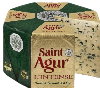
Saint Agur Coupe et LS