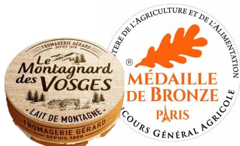
Le Montagnard des Vosges 200g

Pour toute information relative à ce produit, nous vous invitons à contacter votre interlocuteur commercial habituel . Le Service Marketing Savencia Fromage & Dairy Overseas – 79 Rue Joseph Bertrand 78220 VIROFLAY - FRANCE www.savencia-fdo.fr