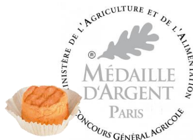
Berthaut Trou du Cru 60g