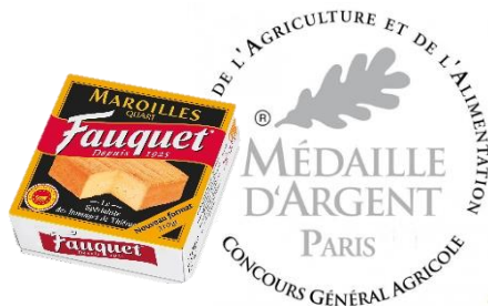
Fauquet Maroilles AOP Quart 210g

Voici donc un récapitulatif de nos fromages récompensés dans leur catégorie :