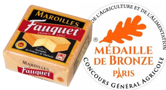
Fauquet Maroilles AOP Coupe 750g