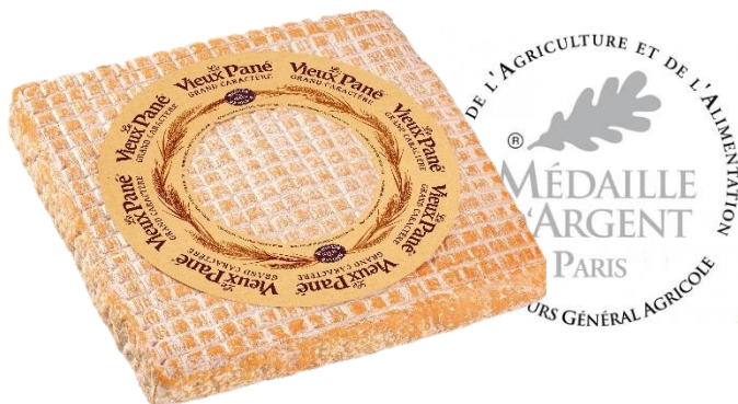
Le Vieux Pané Grand Caractère 2,3kg