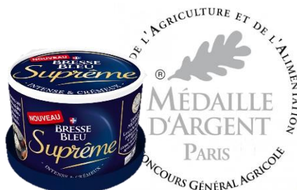
Bresse Bleu Suprême